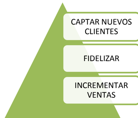
Gráfico No. 3: clientes Distribuidora Amerinda S.A.

Uno de los objetivos de la gerencia regional es establecer acuerdos comerciales en temas de publicidad, con el fin de generar mayor tráfico de personas en los puntos de venta.