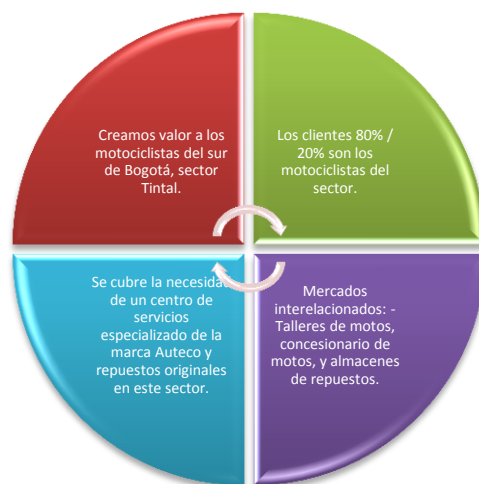
Grafica No 1: segmento de mercado Distribuidora Amerinda S.A

Lo anterior se resume en la siguiente gráfica: